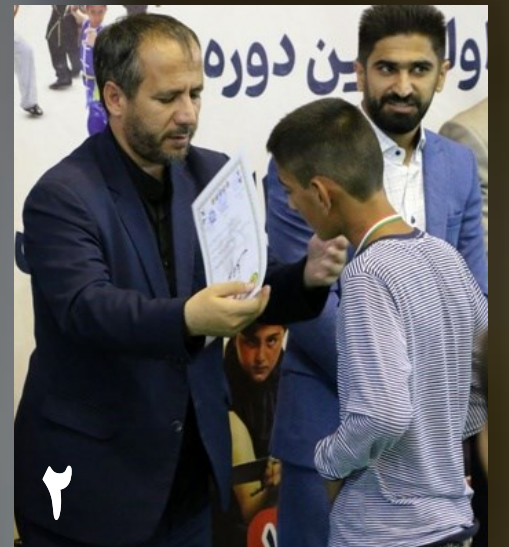
۲ برگزاری اولین فستیوال هنرهای رزمی در اردبیل با همکاری شهرداری اردبیل