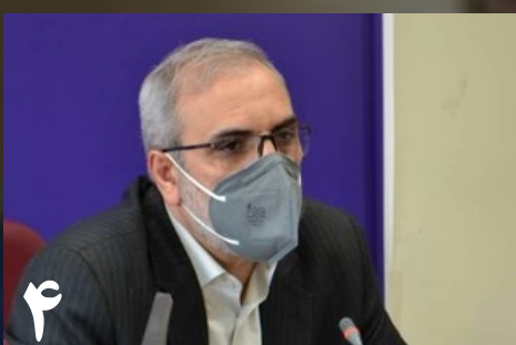
۴ تداوم ارائه خدمات تکنسین‌های اورژانس اردبیل به زائران حسینی